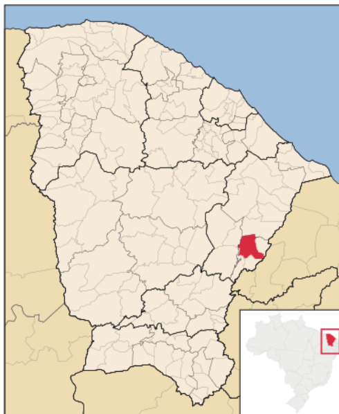
Fig. 01 - Mapa de Localização do Município.

O acesso ao município a partir de Fortaleza, pode ser feito através da BR-116 percorrendo um trajeto de 284 km. A figura a seguir apresenta o mapa do município e a situação em relação ao Estado do Ceará.